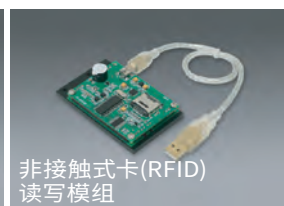
非接触式卡(RFID) 读写模组