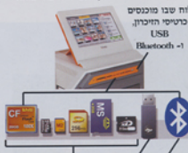
הסוגים השונים של כרטיסי זיכרון

לוח שבו ממוקמים כרטיסי הזיכרון, USB Bluetooth -1