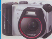
FUJI FinePix HD-3W