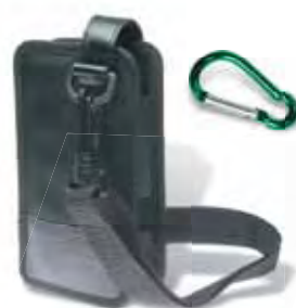
WFT510 Estuche y Gancho